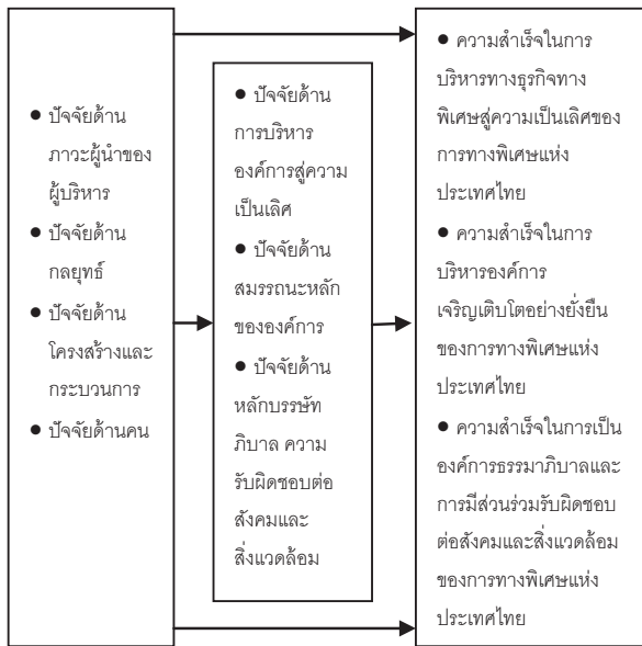
ภาพที่ 1 กรอบแนวคิดแสดงความสัมพันธ์ของตัวแปร